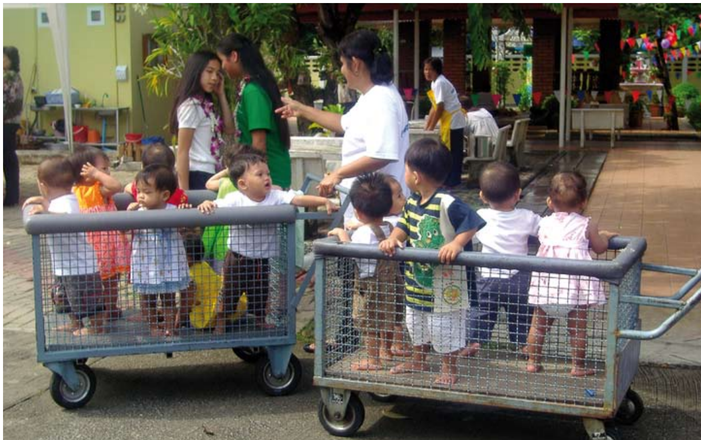
Gruppbarvagnar. Rangsit Babies Home i Thailand.

tel 031-704 60 80 adoption@ffia.se www.ffia.se